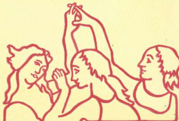
Finito di stampare nel mese di ottobre 2022

L'Erba Canta, associazione culturale, dal 2019 si occupa di escursionismo (trekking e camminate urbane) e turismo ambientale. Per info: escursionismo@erbacanta.it