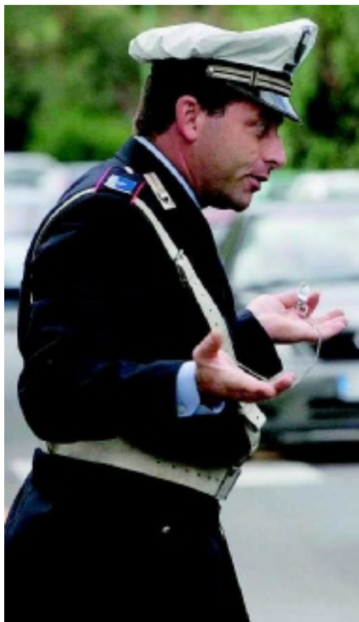
PROTESTE Centinaia di telefonate ai vigili dagli automobilisti rimasti imbottigliati