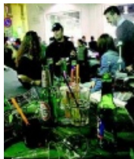
«MOVIDA» Ancora schiamazzi in centro storico